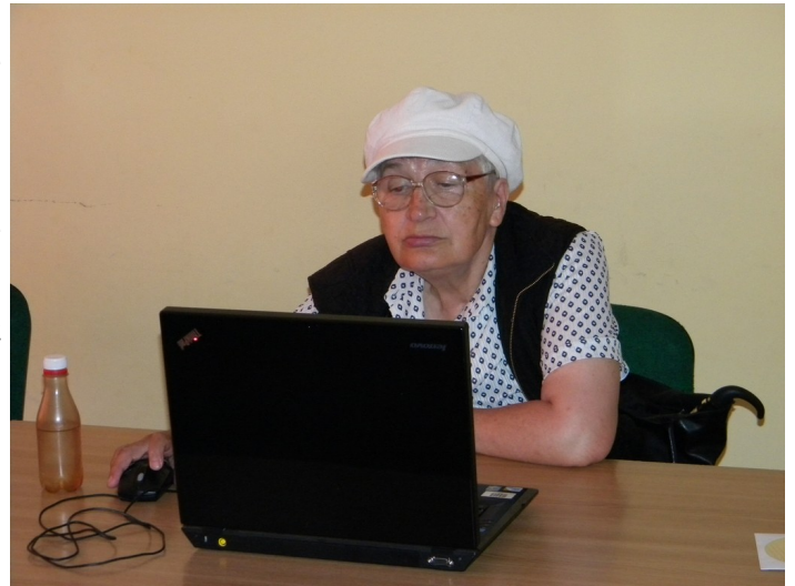
Vârstnicii învață cum să editeze fișiere multimedia și să-și spună digital povestea vieții prin DigiTales

http://www.youtube.com/watch?v=IjB_XaXoq2k ■