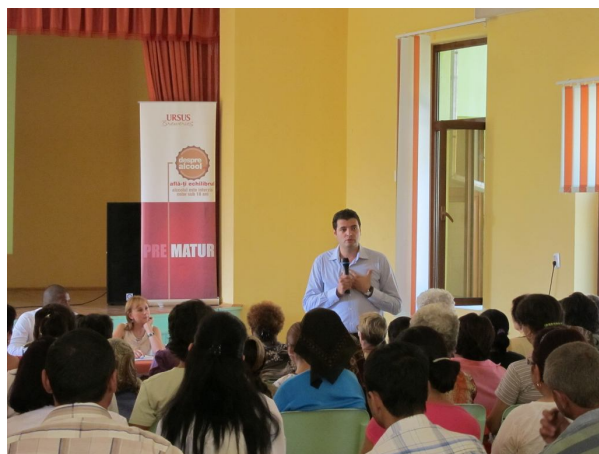
Prezentatorii au povestit la biblioteca din Gherăseni fapte și întâmplări personale despre consumul de alcool în rândul minorilor.