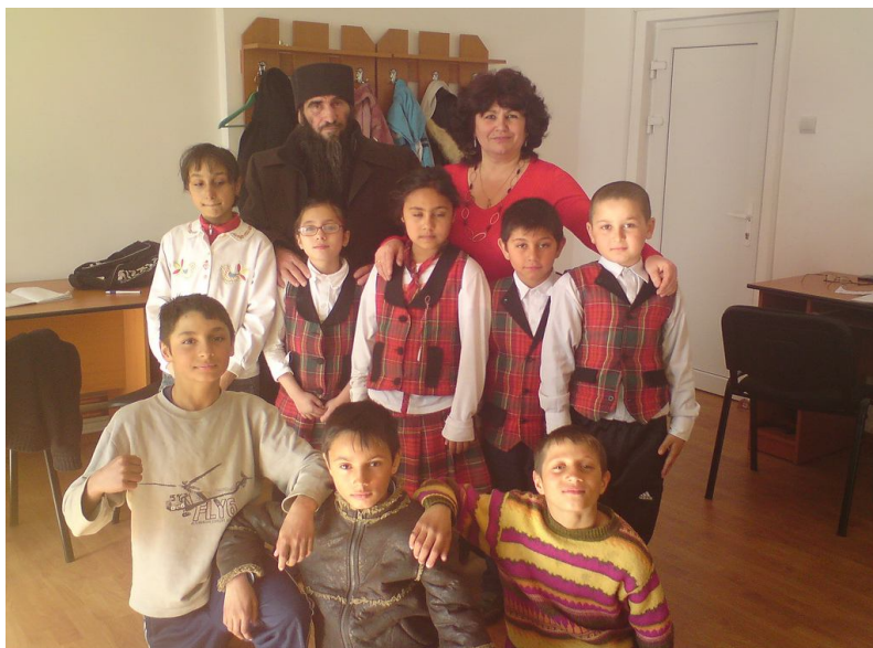
Clubul de activități extrașcolare se reunește la Biblioteca Radu Rosetti

computere vor fi înlocuite cu unele noi, creativitatea și devotamentul bibliotecii de a oferi un spațiu cald în care toți copiii să se simtă bineveniți, să învețe și să exploreze au atras deja membrii comunității printr-un serviciu nou și captivant. ■