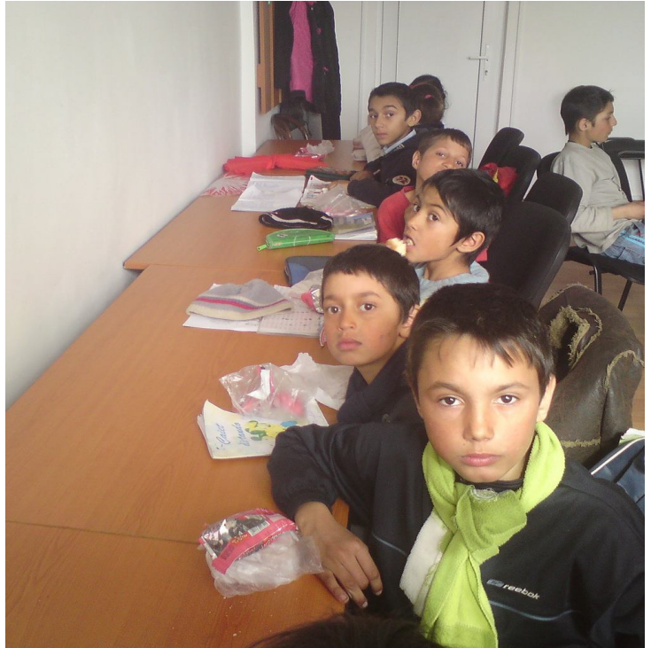
Copiii vin la Biblioteca Radu Rosetti din Onești pentru a primi ajutor la teme, pentru a fi instruiți în noile tehnologii și pentru activități distractive