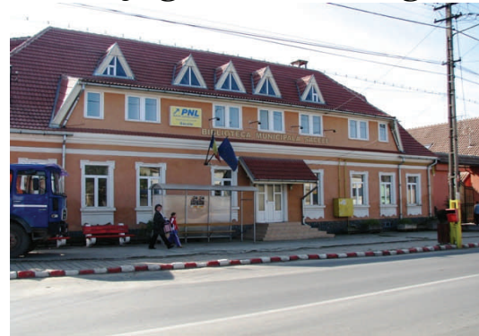
La Biblioteca din Săcele, locuitorii caută să-și includă vecinii rromi prin educație civică și formare IT