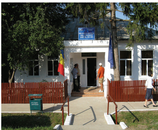
Întâmpinarea vizitatorilor în localul nou renovat

comunitatea a realizat-o în bibliotecă reprezintă, pentru ea, un stimulent important pentru a oferi asistență vizitatorilor bibliotecii. „Deținem acum o clădire bună, cu calculatoare și acces la internet și am început deja să fac planuri de viitor. Îmi voi schimba programul pentru a putea să îi primesc pe cei care doresc să vorbească cu rudele din străinătate, astfel încât duminica va fi o zi aglomerată pentru mine de acum înainte”.