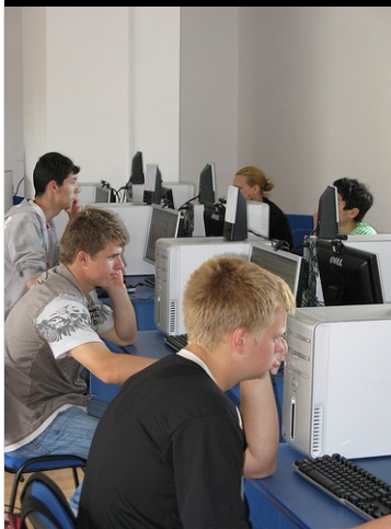
Tinerii care vizitează centrul Internet din cadrul Bibliotecii Județene Tulcea