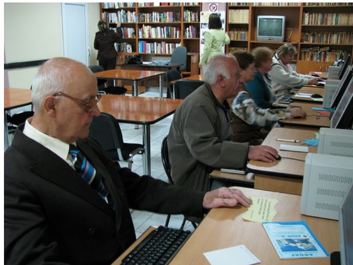
Pensionari învățând să utilizeze calculatoarele

La doar opt zile după deschiderea centrului