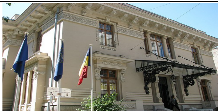
Clădirea Bibliotecii Metropolitane din București, un monument arhitectonic din secolul al 19lea .