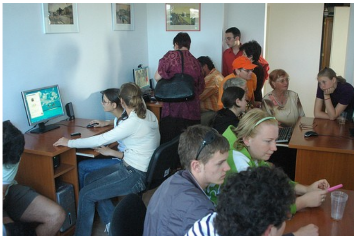
Centrul de Internet center located at the Sulina Public Library

Pe 30 mai, Biblioteca Publică Sulina din județul Tulcea și-a deschis centrul Internet cu acces public gratuit, un centru pilot în cadrul programului Global Libraries-România.