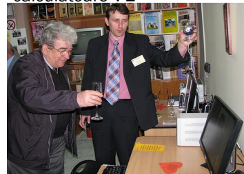
Deschiderea filialei Pensionarilor Biblioteca Județeană Zalău

„capteze și să mențină interesul utilizatorilor în calculatoare”.