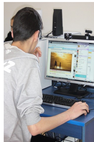
Utilizator accesând Internetul

Pentru a aplica pentru o finanțare în cadrul programului Global Libraries - România în vederea deschiderii unui centru Internet în cadrul unei biblioteci publice, localitățile