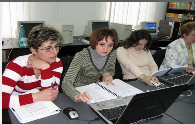
Bibliotecarii au participat la formare IT.

Procesul de evaluare a început în mai și se așteaptă a fi finalizat până în 20 iunie. Rezultatele și schimbările organizaționale planificate vor fi discutate în cadrul unei întâlniri ANBPR odată cu cel de-al treilea eveniment de masă rotundă din cadrul programului Global Libraries din data de 23 iunie. După această întâlnire, IREX va putea înțelege mai bine activitățile care ar putea fi incluse în programul național de consolidare a ANBPR ca și partener pentru sustenabilitatea programului.