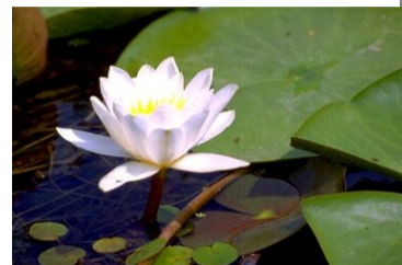
Floare din Delta Dunării