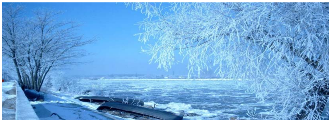
Iarnă în Delta Dunării, județul Tulcea