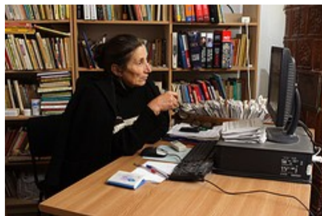
Biblioteca Jurilovca, Județul Tulcea

În acest moment, programul Global Libraries România își desfășoară activitatea cu o echipă compusă din nouă membri. Cu domenii de pregătire, deprinderi și experiență variată în dezvoltarea de programe, toți angajați talentați cu care fundația IREX se măn-